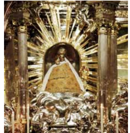
Das Ziel ist erreicht - Innehalten und Danke sagen beim Gnadenaltar

Auf meinen nur 75 geleisteten Kilometern per pedes (im Gegensatz zu anderen Pilgerkollegen) ergab sich für mich jedoch die Erfahrung, dass es Dinge und Personen im Leben gibt, die ei-