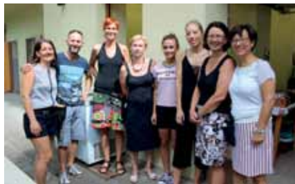
Viele fleißige Hände wurden auch im Service gebraucht

Zuerst viel Sonne am Sonntag Vormittag und dann am späteren Abend noch ein starker Regenguss.