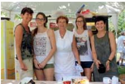
Das bewährte Kuchenbuffet-Team

Viele Helferinnen und Helfer waren auch dieses Jahr wieder mit der Vorbereitung, Durchführung und Nachsorge betraut. Dieses Jahr wollten die Organisatoren für jedes Wetter, ob Regen oder Sonnenschein, gewappnet sein. So wurden diesmal fünf Zelte im Pfarrgarten aufgestellt, was sich als gut erwies.