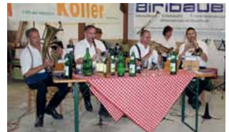
Am Nachmittag spielte die Tanzmusi auf