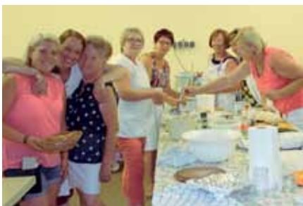
Das Nachmittags-Küchenteam bei der Arbeit