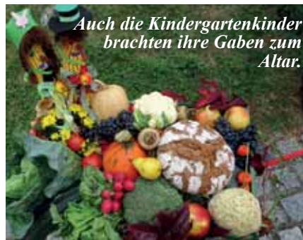
Auch die Kindergartenkinder brachten ihre Gaben zum Altar.