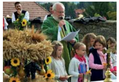
Die Volksschul- und Kindergartenkinder gestalteten den Gottesdienst mit Liedern, Gedichten und Texten mit.

„Wir pflügen, und wir streuen den Samen auf das Land, doch Wachstum und Gedeihen steht in des Himmels Hand: der tut mit leisem Wehen sich mild und heimlich auf und träuft, wenn heim wir gehen, Wuchs und Gedeihen drauf. Alle gute Gabe kommt her von Gott dem Herrn, drum dankt ihm, dankt, drum dankt ihm, dankt und hofft auf ihn!“