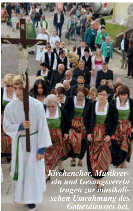
Kirchenchor, Musikverein und Gesangsverein trugen zur musikalischen Umrahmung des Gottesdienstes bei.