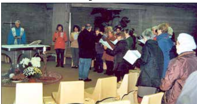
Rosenkranz und Abendmesse vom Kirchenchor (mit)gestaltet