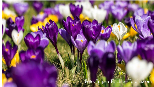
Warten auf die ersten Frühlingsboten

Täglich verbringen die Menschen viel Zeit mit Warten. Warten ist ein Teil des Lebens geworden.